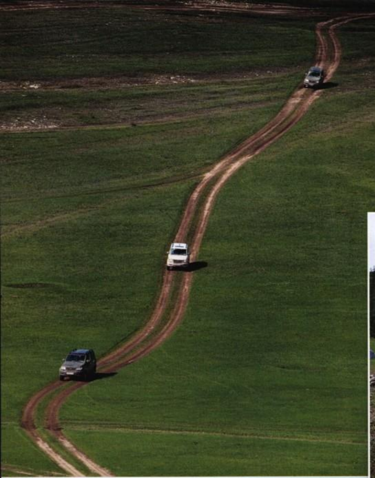
Можно проехать сотни километров по Тажеранским степям и не встретить ни одного человека. Иногда попадаются абсолютно заброшенные деревни, в которых дома-призраки смотрели черными глазницами выбитых окон на наш проезжающий караван.