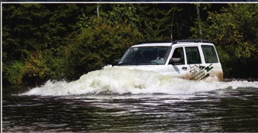
Через реки мы проезжали не по мостам, а напрямик – используя глубокие броды. Внушительный дорожный просвет "Патриота" позволяет преодолевать такие преграды играючи, равно как лесные колеи и каменистые тропы.