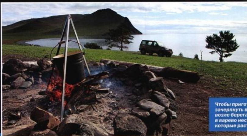
Чтобы приготовить ароматный чай, достаточно было зачерпнуть ведром кристальной озерной воды прямо возле берега, вскипятить ее над костром и бросить в варево несколько горстей боярышника и брусники, которые растут буквально на расстоянии вытянутой руки.